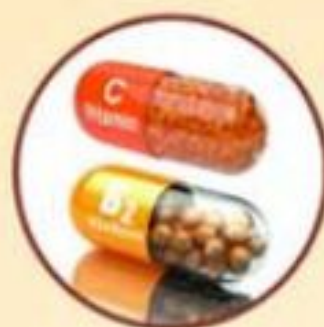
Vitamin C Vitamin B2