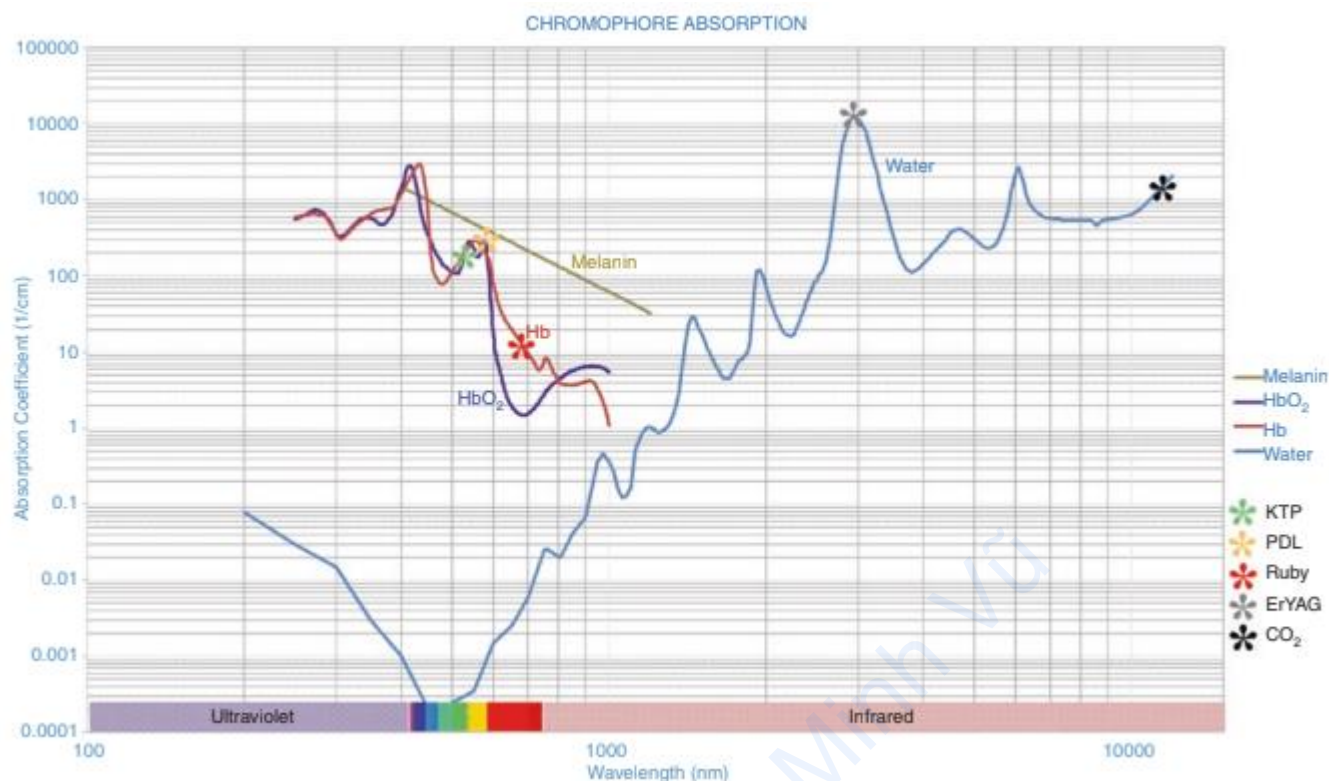
Hình 14.1 Phổ hấp thụ của chromophore ở da với các bước sóng laser phổ biến