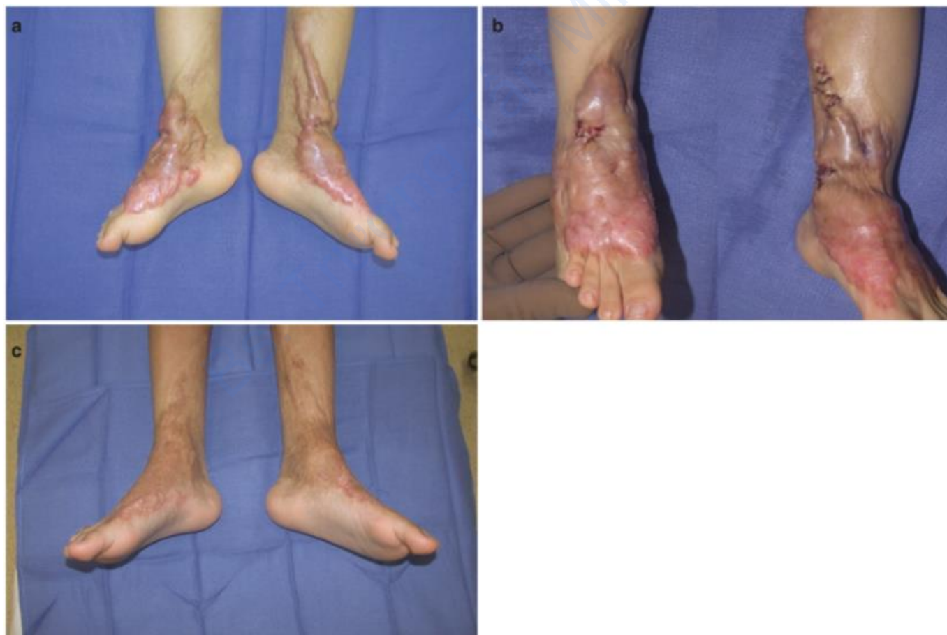
Hình 14.3 (a) Các vết sẹo bồng phì đại lớn ở cẳng chân, mắt cá chân và bàn chân 1 năm sau chấn thương bồng. Ban đầu, ban đỏ và ngứa được điều trị bằng PDL. (b) Lực căng trên các khớp mắt cá chân đã được giảm bớt bằng các phẫu thuật z-plasties nhỏ. (c) Năm năm sau, sau 12 lần điều trị bằng laser với CO2 AFL và corticosteroid tại chỗ, sẹo phì đại đã hoàn toàn biến mất. Không có mô sẹo nào được cắt bỏ.

Độ nhô của sẹo là một đặc điểm khác để đánh giá. Sẹo có thể bị teo (thường xảy ra với sẹo mụn trứng cá), phẳng với vùng da xung quanh nhưng có sự bất thường về cấu trúc bề mặt (ví dụ: các vị trí ghép da và cấy ghép) hoặc phì đại / lồi với một số trường hợp có biểu hiện nhô ra vài cm so với da xung quanh ( Hình 14.3 và 14.4 ).