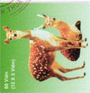
60 Viên (12 X 5 Viên)