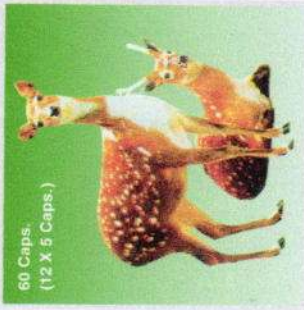
60 Caps. (12 X 5 Caps.)

PHILINTER PHARMA Sân xuất tại: CTY TNHH PHILINTER PHARMA 26, đường số 8, KCN Việt Nam, Singapore, Bình Dương