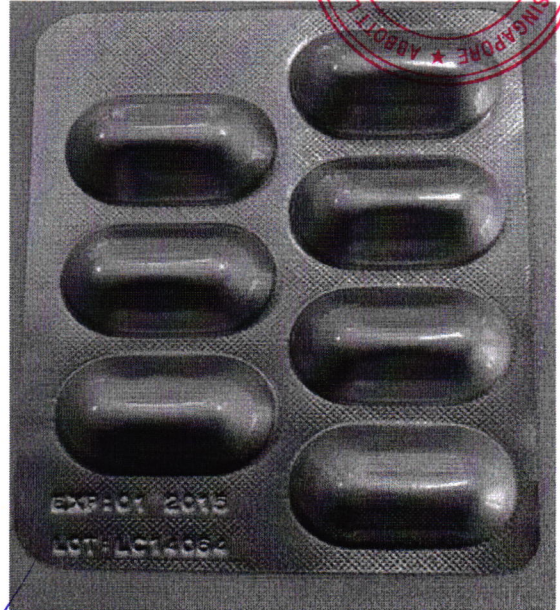
Blister of SCOLANZO 15 mg Dimension: 81,5 x 65 mm

The information of LOT and EXP will be embossed online in process of production/ Thông tin về "LOT" và "EXP" sẽ được dập nổi trực tiếp trong quá trình sản xuất