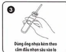
Dùng ống nhựa kèm theo cắm đầu nhọn sâu vào lọ