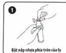
Bật nắp nhựa phía trên của lọ