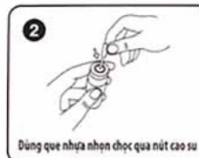
Dùng que nhựa nhọn chọc qua nút cao su