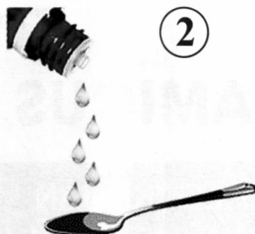
2 Mỗi lần 5 giọt