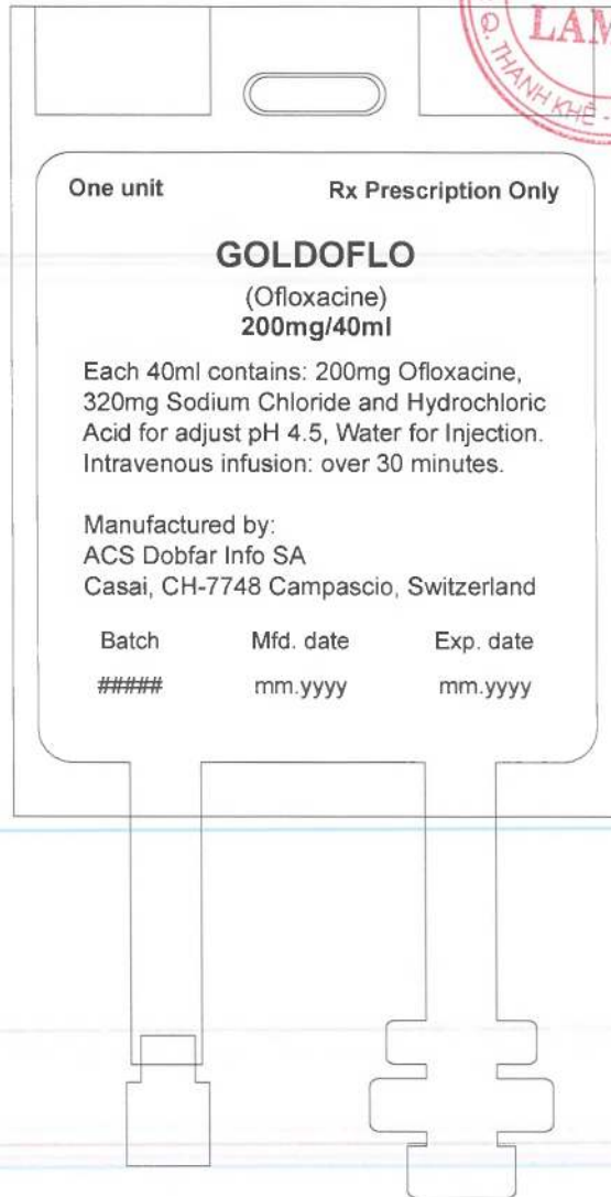
PVC bag's label