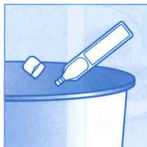
3 Không được tái sử dụng!