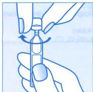
1 Vặn rời nắp ống thuốc.