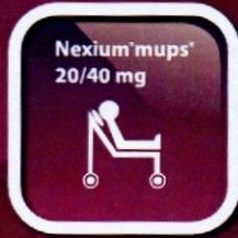
Bơm qua ống sonde đối với bệnh nhân không nuốt được