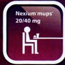
Phân tán trong nước đối với bệnh nhân khó nuốt