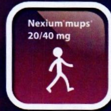
Uống trực tiếp

* Multi Unit Pellet System (MUPS): cấu trúc đa tiểu vi hạt 1. Thông tin kê toa đã được Cục Quản lý Dược - Bộ Y Tế phê duyệt